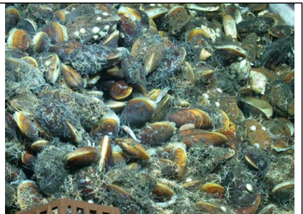
Vue rapprochée d'un amas de moules hydrothermales sur le site Irina II de la zone Logatchev, dorsale Médio-Atlantique (Profondeur 3200 mètres). Cers moules font 10-12 cm de long.