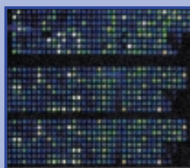
La référence: La puce à ADN sur verre pour l'analyse globale d'un génome (densité typique de 12 000 gènes sur cm 2 ).

Les Puces à ADN portent des sondes génétiques (molécules d'ADN) à leur surface et permettent d'analyser des échantillons biologiques pour le diagnostic génétique et les études des programmations cellulaires (développement, réponses à l'environnement, cancérisation, réponses aux stress, aux drogues...). Sur une seule puce, l'ensemble du génome humain (30 000 gènes) peut être analysé en une étape.