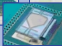
La puce MeDICS pour la manipulation individualisée de milliers de cellules en parallèle