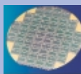
L'analyse au lit du malade : intégration de la préparation de l'échantillon d'ADN et son analyse par hybridation.

Les LaboPuces sont conçus pour intégrer des étapes successives de transformation et d'analyse de l'échantillon : véritables laboratoires miniaturisés, ils répondent à un besoin d'analyse automatique, haut débit et à bas coût.