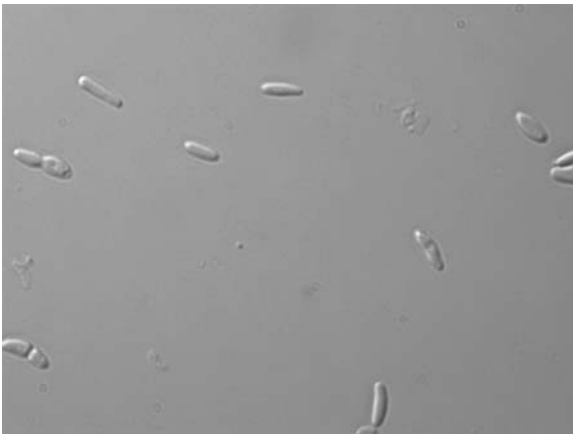
Cellules bactériennes d'E. Coli dépendante d'un apport en un des 4 composants universel de l'ADN, la thymine.

Ce changement radical dans la composition chimique d'un organisme vivant présente un grand intérêt pour la recherche fondamentale. De plus, comme l'explique Ph. Marlière, « ces travaux constituent une avancée importante de la xénobiologie, une branche émergente de la biologie synthétique ». Cette discipline récente des sciences de la vie a pour objectif la conception d'organismes non naturels dotés de capacités métaboliques optimisées pour l'élaboration de modes alternatifs de synthèse. Ces derniers devraient permettre la production de composés chimiques d'intérêt, notamment dans le domaine de l'énergie. Dans cette perspective, les organismes synthétiques, comme ceux sélectionnés ici, présenteraient l'avantage de dépendre, pour la constitution de leur matériel génétique et leur prolifération, uniquement de composés absents dans les milieux naturels. A terme, ils ne pourront ainsi ni entrer en compétition, ni échanger de matériel génétique avec les organismes sauvages et sont voués à disparaître en absence du xénobiotique dont ils dépendent.