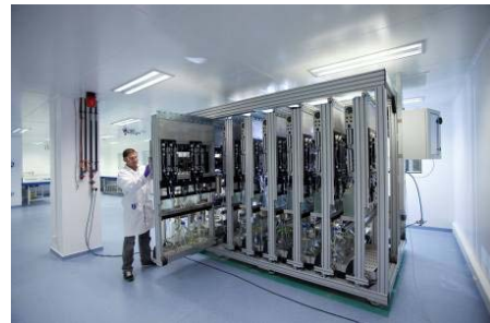
Dispositif de culture automatisée de cellules, Genoscope.

Les chercheurs ont mis en œuvre une technologie originale, développée par Ph. Marlière et R. Mutzel, qui permet l'évolution dirigée d'organismes dans des conditions strictement contrôlées. Il s'agit d'un dispositif de culture automatisée de cellules (cf. photo ci-contre) dans lequel de larges populations de bactéries sont cultivées, de façon prolongée, en présence d'un composé chimique toxique à des concentrations sub-létales 1 . Ces conditions de cultures entraînent alors la sélection de variants génétiques tolérant des concentrations plus élevées de ce composé toxique. En réponse à l'apparition de ces variants dans la population cellulaire, le dispositif automatisé adapte la composition du milieu de culture pour imposer une pression de sélection constante.