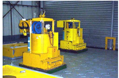
Vue du bâtiment 58 et de 2 châteaux de transfert

Le bâtiment 58 de l'installation nucléaire de base 166 est destiné à l'entreposage de décroissance des déchets moyennement et hautement irradiants. Les fûts renfermant les déchets y sont conservés à titre temporaire dans des puits et alvéoles, en attendant leur traitement ou la disponibilité d'une filière d'évacuation dédiée (cf. Rapport d'information sur la sûreté nucléaire et la radioprotection du CEA/Fontenay-aux-Roses, édition 2010).